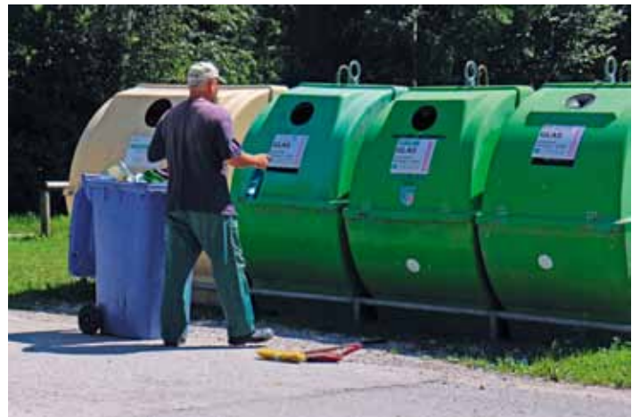
Die richtige Wahl des Containers – welcher ist der Richtige?

Nach Angabe der Süddeutschen Altglas-Rohstoff GmbH gehören die blauen Gläser zum Grünglas. Grünglas ist die Glasfraktion, bei der ein kleiner Anteil Fremdfarben geduldet werden kann. Keinesfalls dürfen diese aber zum Weiß- oder Braunglas.