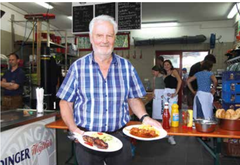
Ortsfest in Niederding – guten Appetit!