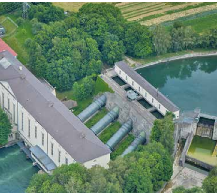
Ein Blick auf das Wasserkraftwerk in Aufkirchen