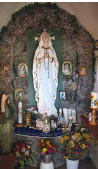
Seit mehr als sieben Jahrzehnten kann jeder der möchte in der liebevoll gehegten Brunnerkapelle in Schwaig Einkehr und Andacht finden