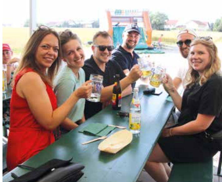
Ob von den 400 Steckerlfischen beim Fischerfest in Oberding einer übrigblieb?