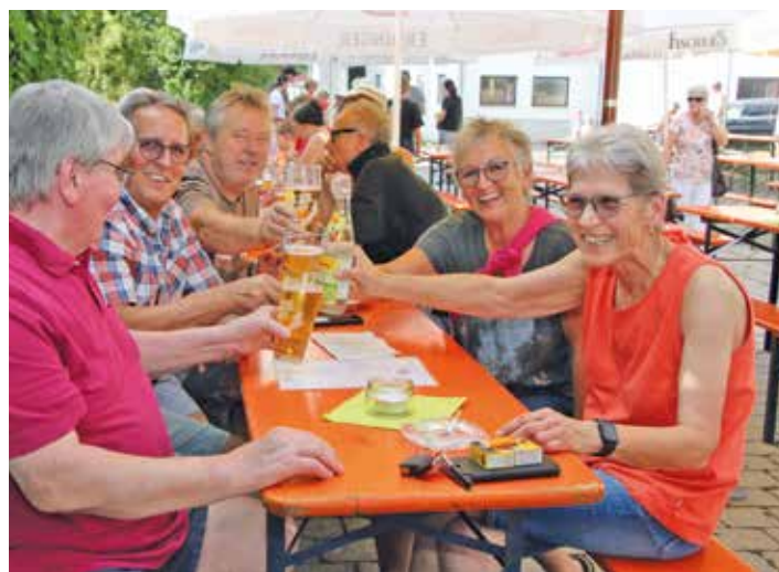
Steckerlfisch und kühle Getränke waren auch beim Grillfest in Aufkirchen sehr beliebt

Nach dem Essen war Barbetrieb und später wurde es romantisch, als auf den Tischen