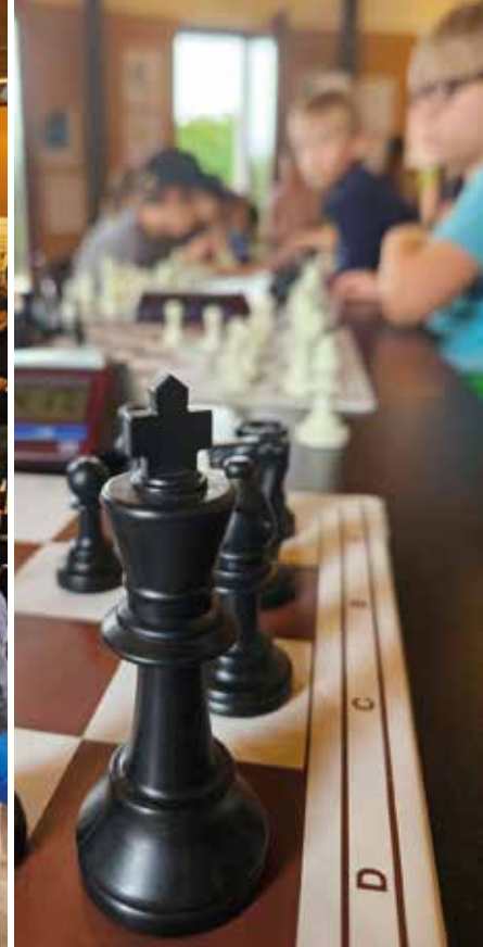
Für diese 140 Mädchen und Jungen sind es diese schwarz weißen Bretter die ihnen die Welt bedeuten