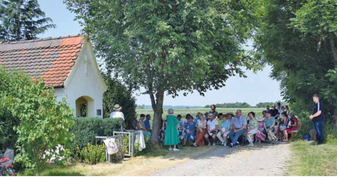
Neben Familienmitgliedern fanden sich auch zahlreiche andere Gläubige ein, um das 70jährige Jubiläum der Brunner Karl-Kapelle in Schwaig mit einer speziellen Gedenkandacht zu feiern