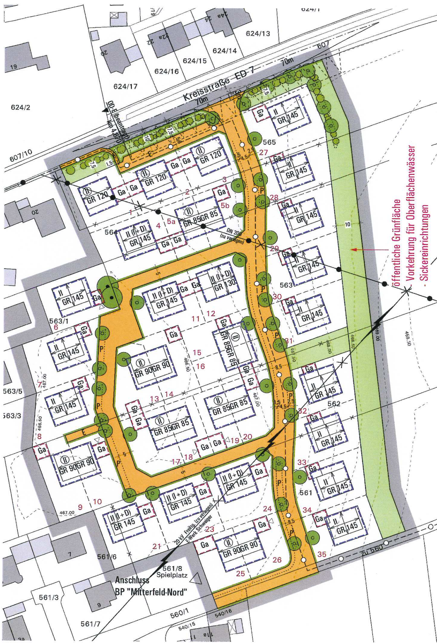
Ausschnitt rechtsverbindlicher Bebauungsplan