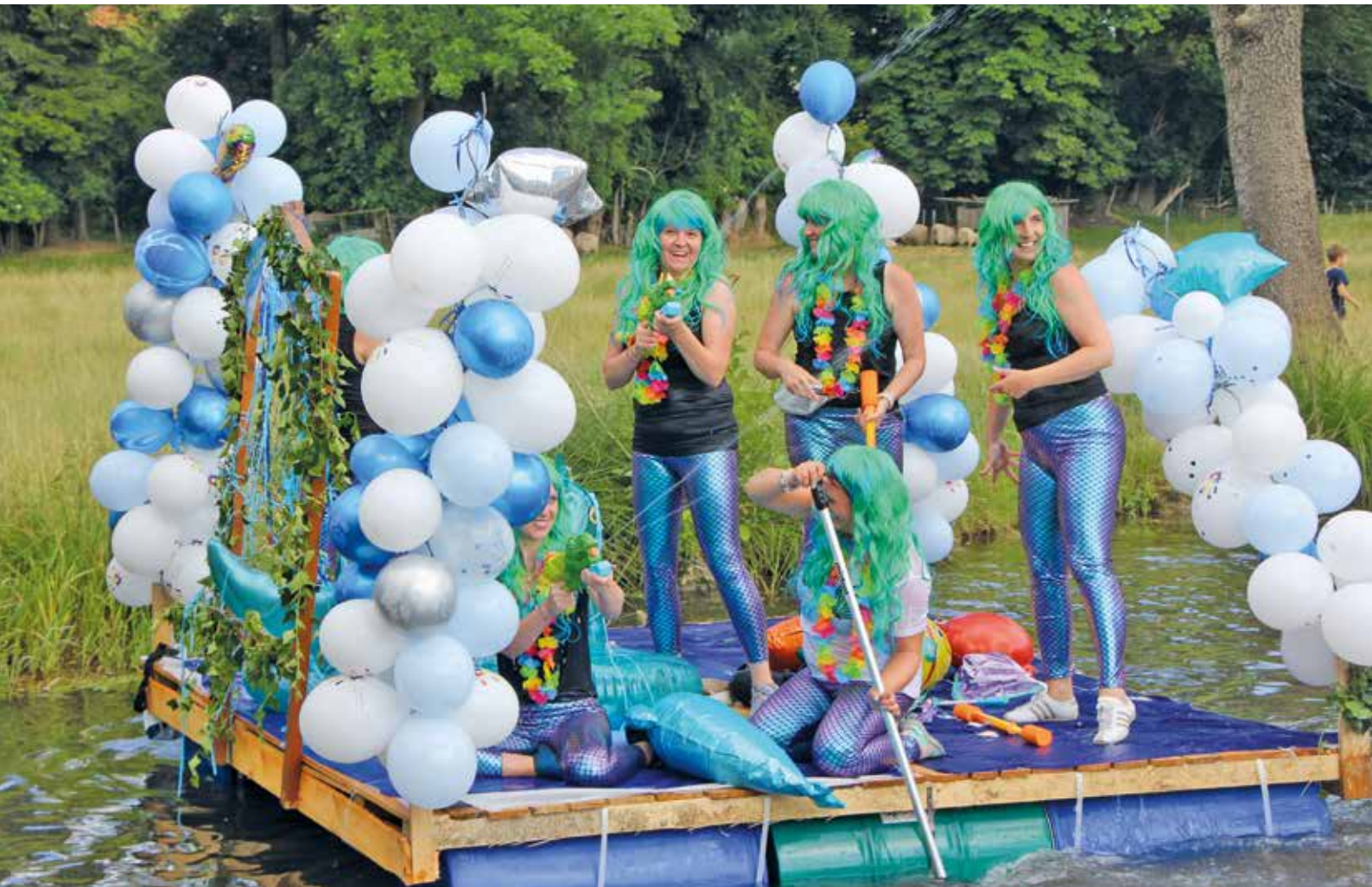
Der „Schönheitspreis“ ging an die bezaubernden Moosnixen vom KiTa-Verbund Erdinger Moos.

Im Rahmen des Ortsfestes organisierte heuer die Landjugend wieder das Bachrennen auf der Dorfen. Acht Boote waren gemeldet, die am Samstagnachmittag mal mehr mal weniger schnell auf der Dorfen unterwegs waren. Bedingung war, dass die Boote