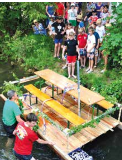
Das Bachrennen brachte für so manche Teilnehmer eine willkommene Abkühlung bei heißen Temperaturen