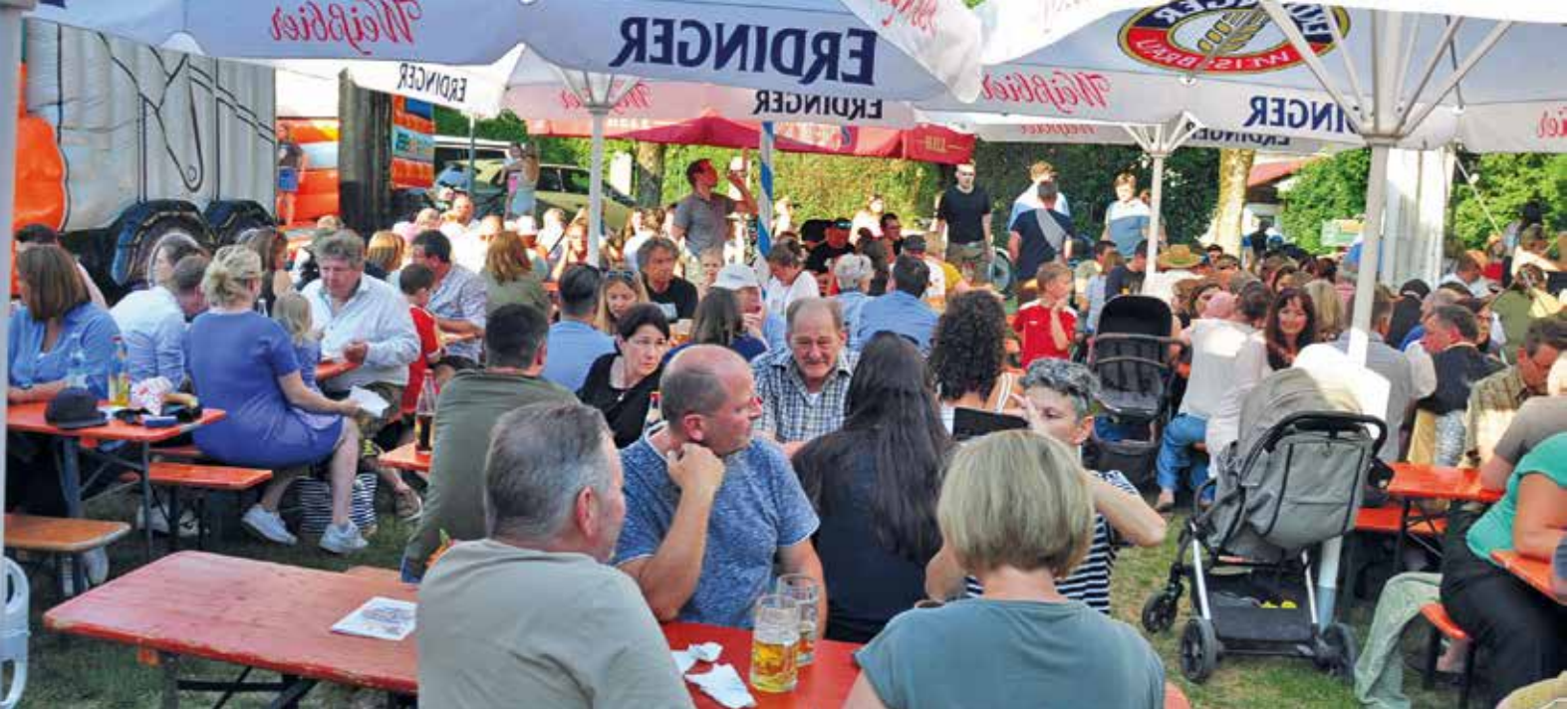
Festzelt und Biergarten waren sehr beliebt bei Oberdings Bevölkerung und vielen anderen Besuchern.