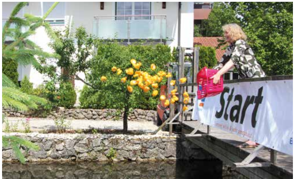
Auf geht's zum Entenrennen!