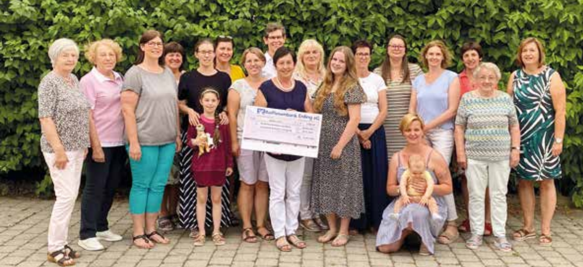
Ein Teil der fleißigen Kuchenbäckerinnen präsentieren stolz den Spendenscheck. Über den Betrag von 2.000 Euro darf sich das Kinderpalliativteam des Landshuter Kinderkrankenhauses freuen.