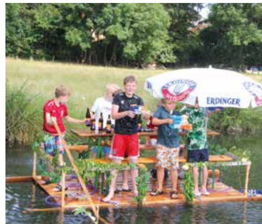
Der „Fendt“ der Landjugend“ war am schnellsten! – Spaß am Bachrennen hatten alle, Publikum und Besatzung

Beschuss bedeutet in diesem Fall jede Menge Wasser aus Spritzpistolen, was von den Booten erwidert wurde, dies dann aber gleich mit einem kräftigen Wasserstrahl aus dem Gartenschlauch. Die effektivste Möglichkeit, dem Publikum etwas