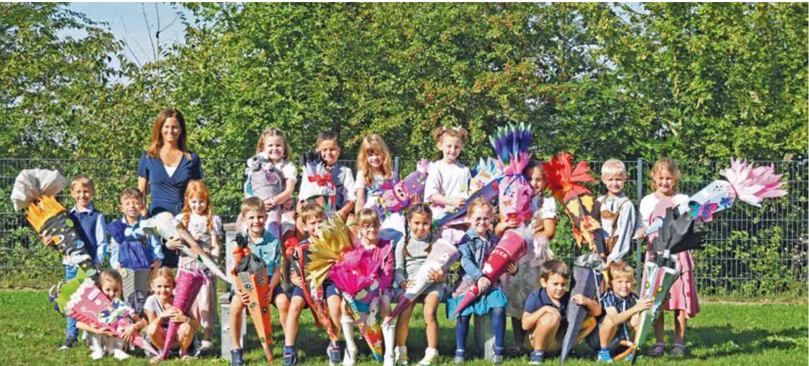
Die Klasse 1c