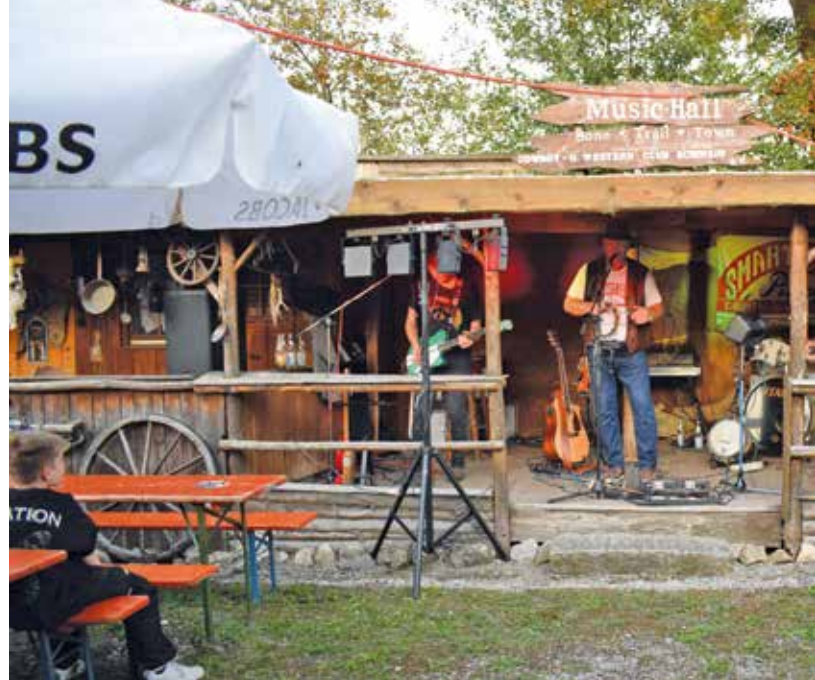
Für die perfekte musikalische Untermalung sorgten die „Smart Coon Pickers“ aus München beim diesjährigen Schwaiger Ranchfest

📍 Birkeneck 1, 85399 Hallbergmoos ☎ 0811/82-0 ✉ bewerbung@birkeneck.de 🌐 www.birkeneck.de