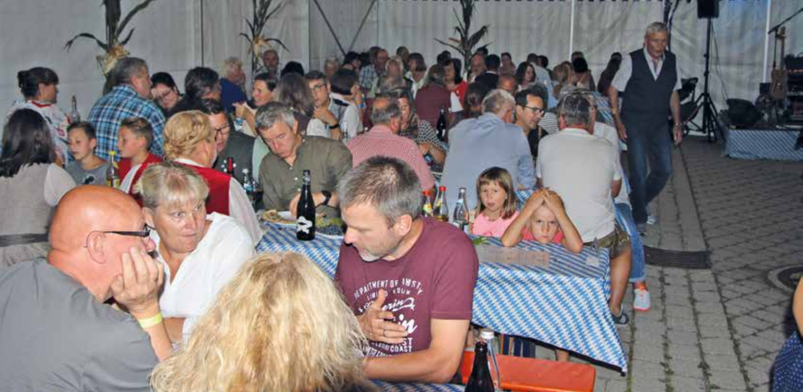
Viele Gäste beim Weinfest der Feuerwehr Aufkirchen