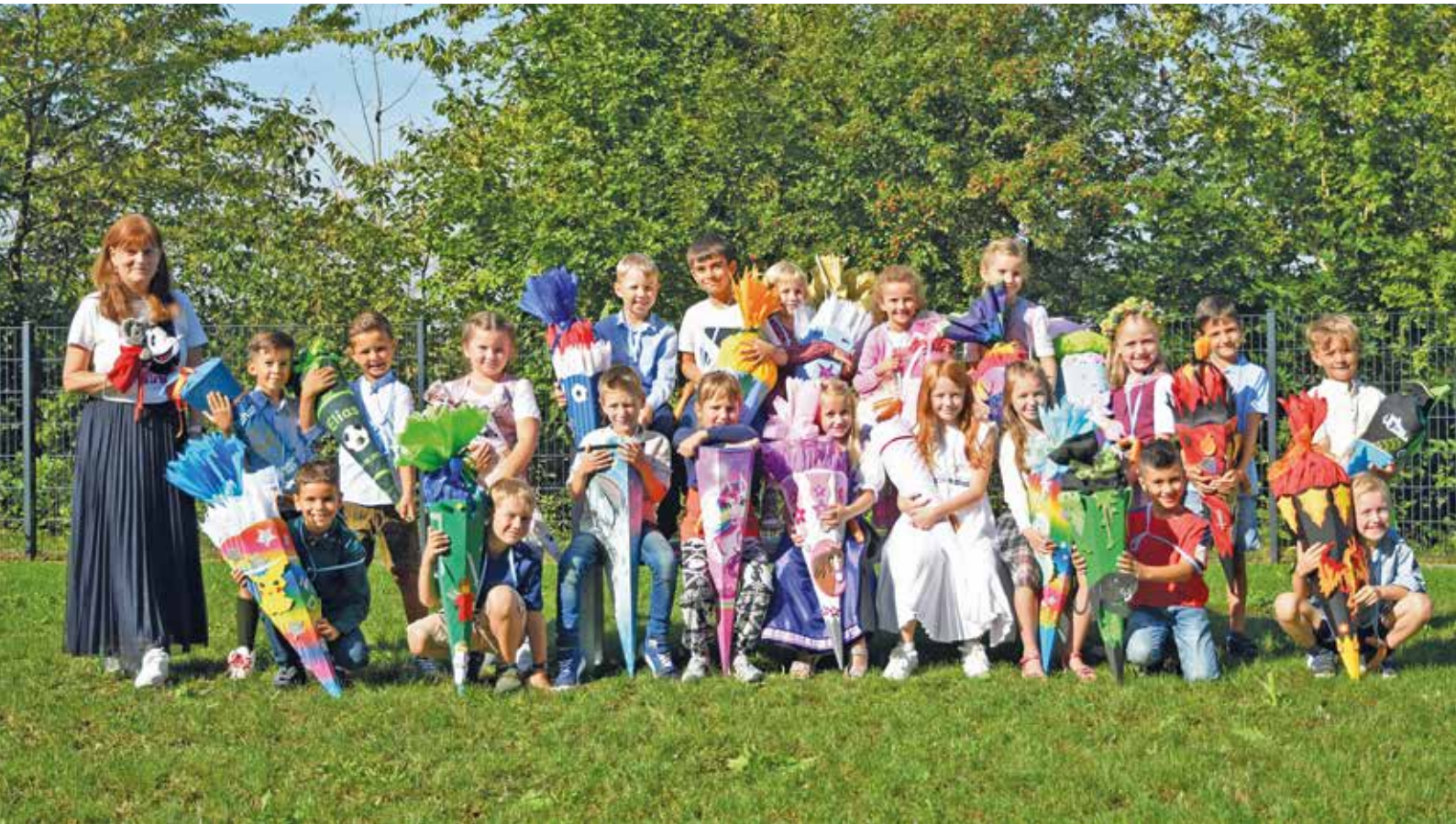
Die ABS Schützen der Klasse 1b strahlten vor Freude mit der Sonne um die Wette

F ür zahlreiche Mädchen und Jungen war am Dienstag, den 12.09.2023, ein ganz besonderer Tag im Leben: Der erste Schultag in der Grundschule Oberding!