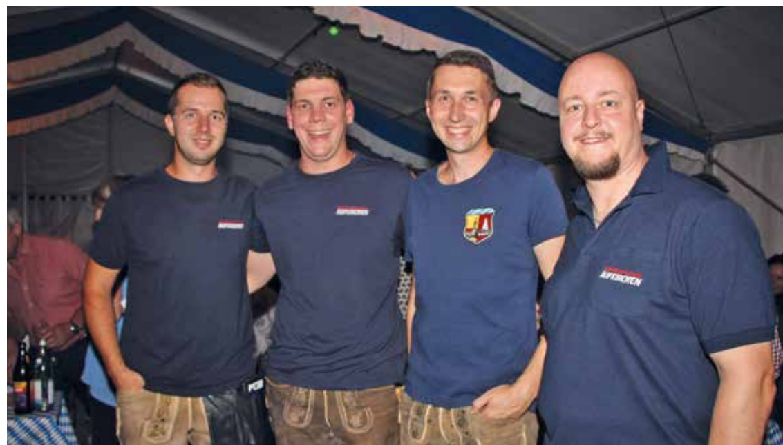
Geballte Manpower! Vier der rund 20 freiwilligen Helferinnen und Helfer