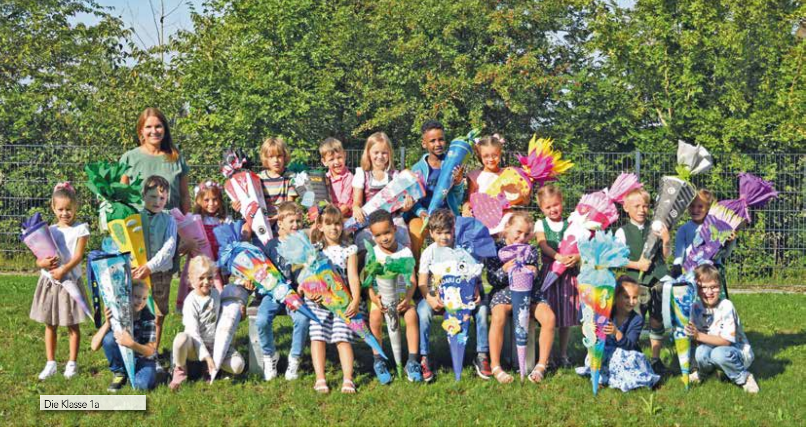
Die Klasse 1a