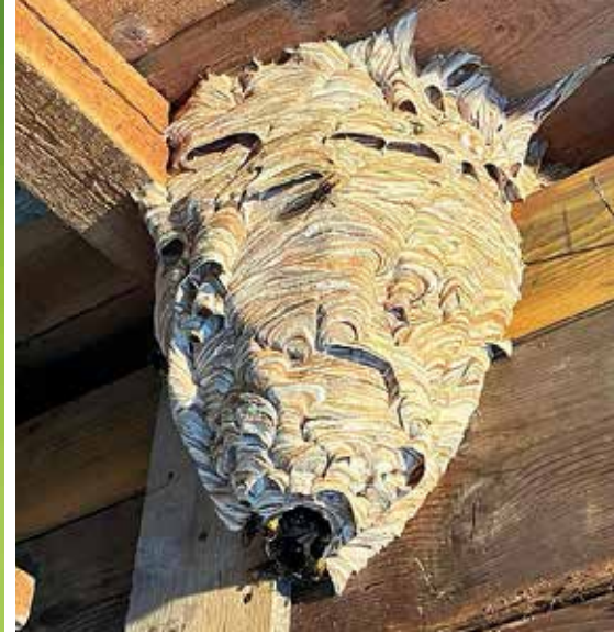
Das Hornissennest von Aufkirchen