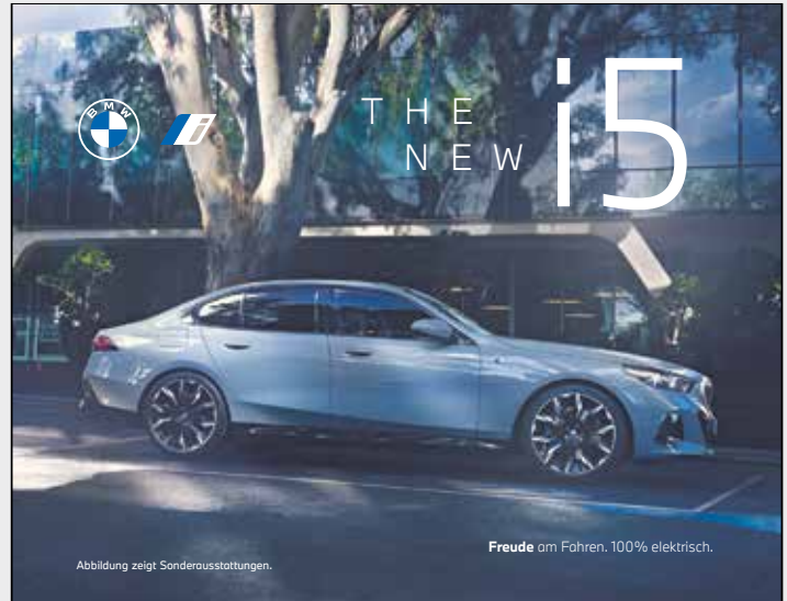
Abbildung zeigt Sonderausstattungen.

Mit Zusendung der Bewerbung stimmen Sie der Verarbeitung personenbezogener Daten zu ( https://oberding.de/gemeinde-oberding/startseite/stellenangebote ).