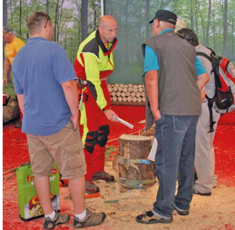
Auf Messen führen die SVLFG-Präventionsfachleute Arbeitsmethoden vor, die das Unfallrisiko bei der Waldarbeit senken, beraten anhand des Stockbildes und benennen klar, welche Arbeiten Forstprofis überlassen werden sollten.

Das höchste Risiko, bei der Waldarbeit tödlich zu verunglücken, besteht bei motormannuellen Holzerntearbeiten. 24 der 33 tödlichen Unfälle lassen sich darauf zurückführen, dass Menschen bei Fällarbeiten von Baumteilen getroffen werden. Weitere vier Personen verunglückten tödlich durch indirekte Folgen bei der Holzernte, zum Beispiel durch nachfallende abgestorbene Bäume. 1.596 (2021: 1.482) Personen wurden dabei verletzt. Bedingt durch den Waldboden verunglückten 957 Personen, weil sie stolperten, ausrutschten oder stürzten. 213 Unfälle im Zusammenhang mit Forstseilwinden (2021: 169) ergaben in diesem Bereich 26 Prozent mehr, wohl auch zusammenhängend mit der gestiegenen Brennholzaufarbeitung.