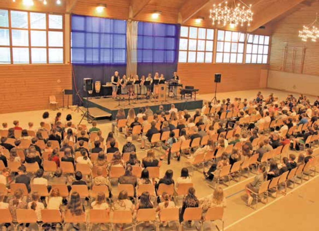
Zur großen „Jahresende-Feier“ traf sich die Schulfamilie der Realschule Oberding in der Mehrzweckhalle.