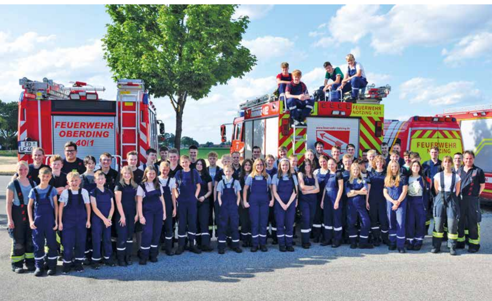
Gruppenbild mit Ausbilder und Betreuer. Sechzig Mädchen und Jungen haben an der Übung teilgenommen.

G anze Sechzig Jugendliche der Feuerwehren Aufkirchen, Notzing, Niederding und Oberding nahmen an der diesjährigen 24-Stunden-Übung der Gemeinde Oberding teil. Immer wieder wurde der Feuerwehrynachwuchs zu diversen kleineren Übungseinsätzen gerufen, die unter der Aufsicht der