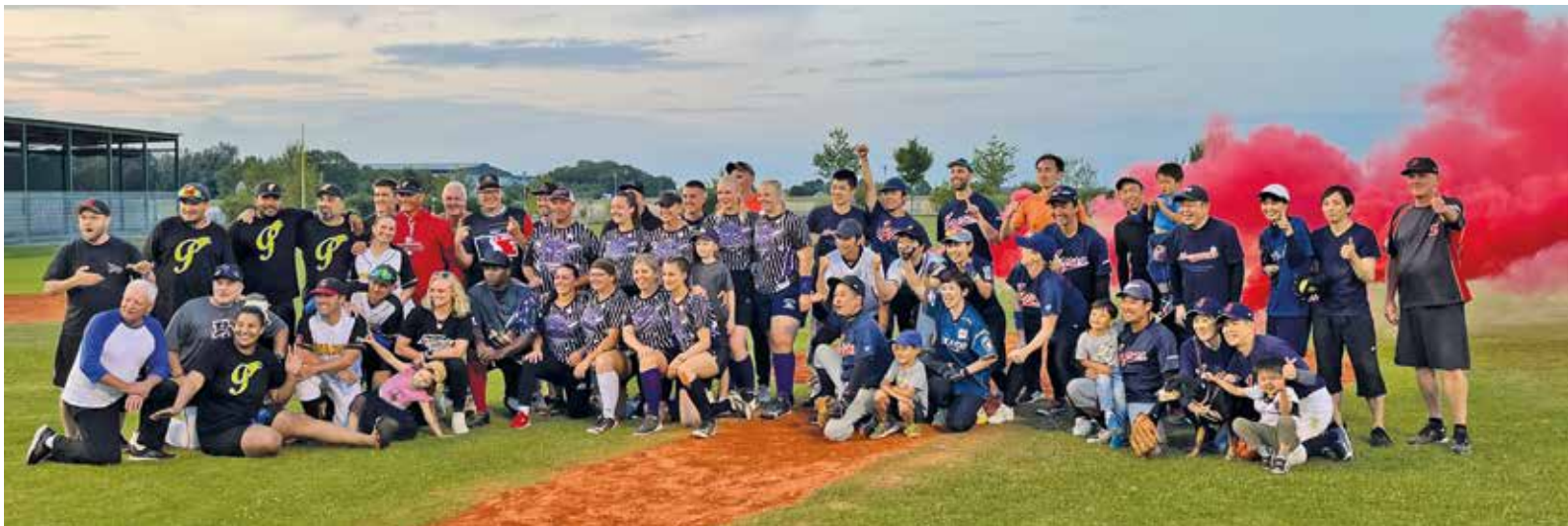
So sehen Sieger aus: Die beiden Finalisten des Turniers (München M-Jäger und Balls & Dolls) sowie der frisch gekürte Bayerische Softball-Meister aus Fürth hatten allen Grund zum Feiern