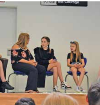
Bild 1: Da brodelt die Gerüchteküche – die Mitschüler der Toten rätseln, was genau passiert sein könnte und was man davon in den sozialen Medien zeigen kann